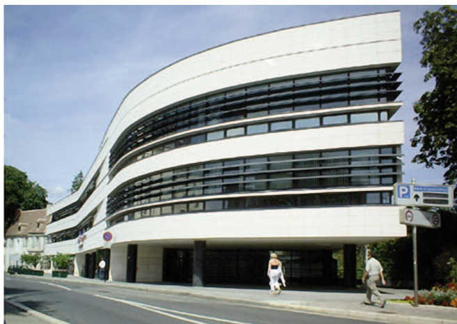
Mairie de Bourges : 11, rue Jacques Rimbault à Bourges

Le nombre de places est limité à une centaine de personnes (jauge liée aux conditions sanitaires).